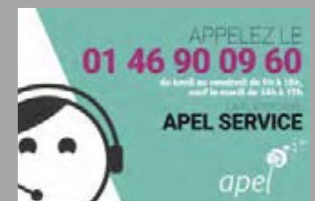
PLATE FORME APEL SERVICE une équipe de spécialistes (psychologues, éducateurs spécialisés, juristes...) répond aux questions des familles.

Magazine réservé aux familles adhérentes 5 n°/an. Infos pratiques, témoignages, pistes de réflexion sur la scolarité et les questions éducatives.